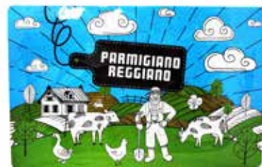
ランチョンマット (2枚セット) 43.5cm x 28cm