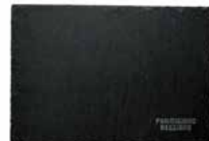
粘板岩のプレート 18cm x 26cm