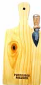
カッティングボード (カッティングナイフ付き) 30.5cm x 13.5cm