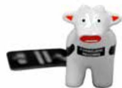
キーホルダー (牛) 7cm x 3.5cm x 5cm