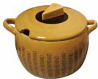
セラミック陶器 外径 23cm x 高さ 19cm