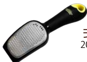
チーズ削り (スコップ型) 20cm x 6cm