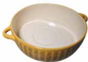
セラミック陶器 外径 30cm x 高さ 9cm