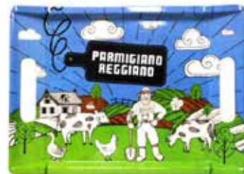
トレイ 32cm x 23.2cm x 3.1cm