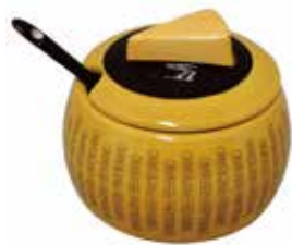
チーズ削り入れ (スプーン付き) 外径 9.7cm x 高さ 8.7cm