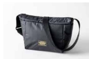
保冷バッグ 23cm x 19cm x 13cm