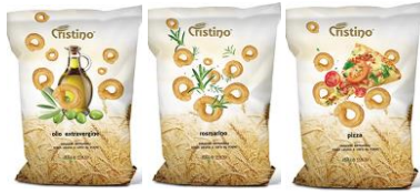
パレーニ ローザマリ ピッツァ

小麦粉・卵・オイル・白ワイン・塩を使ってオープンで焼き上げたブーリア州の固焼きパンです。ワインやビール、サラミの盛り合わせなどパン・グリッシーニと組み合わせてお使い下さい。 製造国：イタリア 内容量：200g